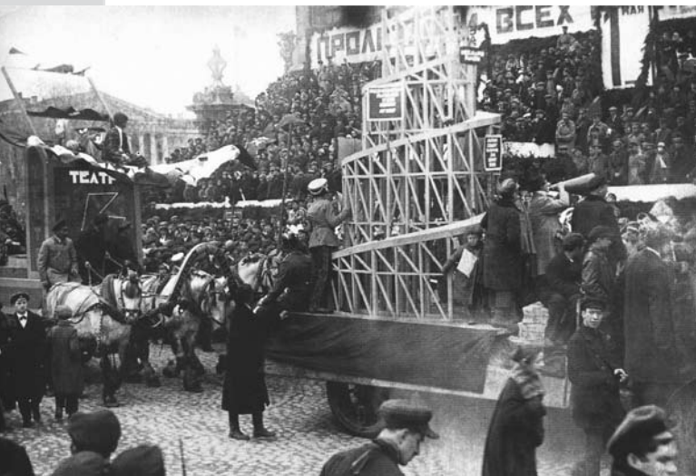
Moskou, 1920: Vladimir Tatlin's model voor het 'Monument voor de Derde Internationale' wordt getoond in een optocht. De toren zou 400 meter hoog worden – van ijzer, glas en staal – en werd gezien als hét symbool van de moderniteit. De toren is nooit gebouwd.

Als lid van dit gilde zult u op een hele bijzondere manier deel uit maken van de kunsttentoonstelling Sonsbeek 2008. Wilt u lid van dit gilde worden en/of meer informatie krijgen, dan nodigen wij u uit een email sturen naar sonsbeekgilde@gmail.com . Dat geldt niet alleen voor de leden van Vrienden van Sonsbeek maar ook voor uw huisgenoten, familieleden, burens, vrienden. Op woensdag 16 januari organiseren we een bijeenkomst voor aangemelde gildeleden en geïnteresseerden. Wie zich per email met naam en emailadres aanmeldt krijgt een uitnodiging. Wij zouden vereerd zijn met een gilde van de Vrienden van Sonsbeek!