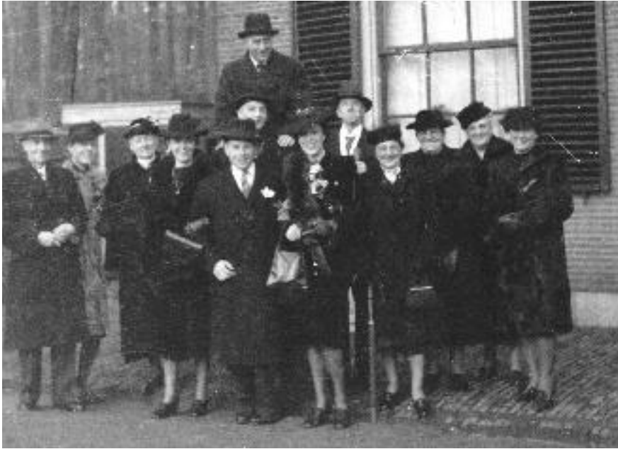
Nog een foto met bruiloftsgasten voor het koetshuis bij Hotel-Pension Sonsbeek, genomen tussen 4 en 10 december 1942. De grootouders van Inge Brainich komen op de foto's niet voor.