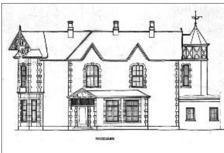
Bouwtekeningen van Het Jachthuis noordzijde en zuidzijde