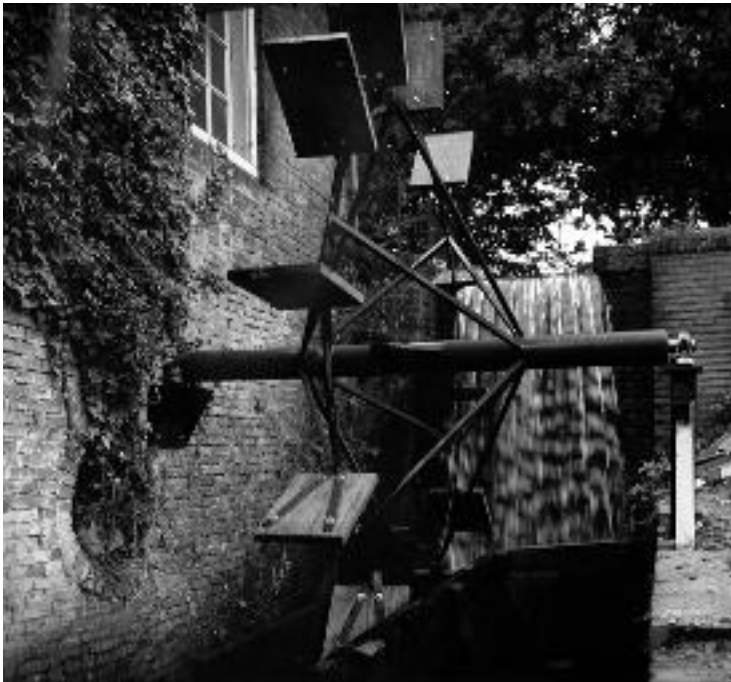
Foto uit 1992 van het schoepenrad van de Begijnemolen. In 1994 vervangen door het historisch meer correcte houten rad.