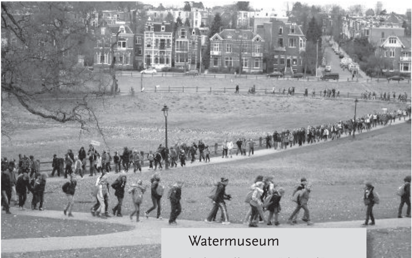
Tijdens Wereldwaterdag sjouwen scholieren met water op de rug rond het Watermuseum. Foto 20 maart 2013.