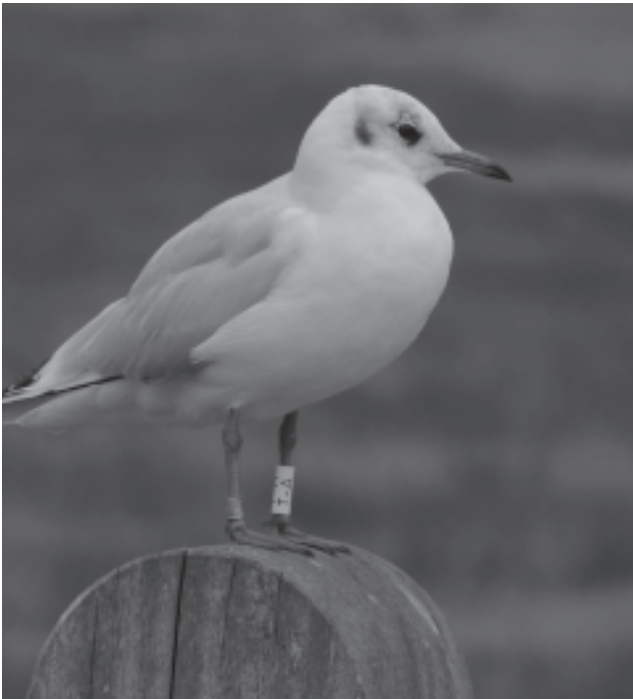
Kokmeeuw Wit TA:

Deze geringde Kokmeeuw is in de winter vaak bij het watermuseum te vinden en broedt 's zomers in Polen