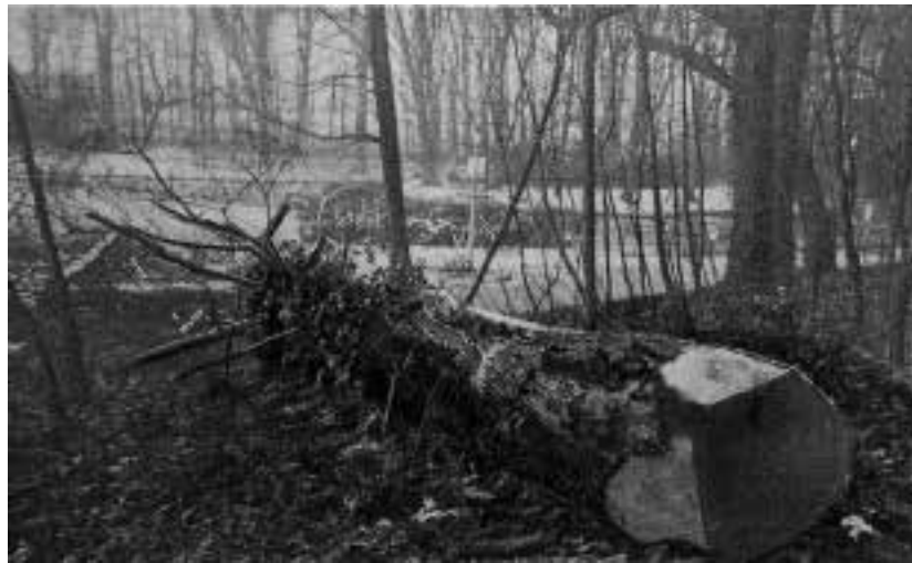
De gekapte Libanon Ceder in Sonsbeek 1910